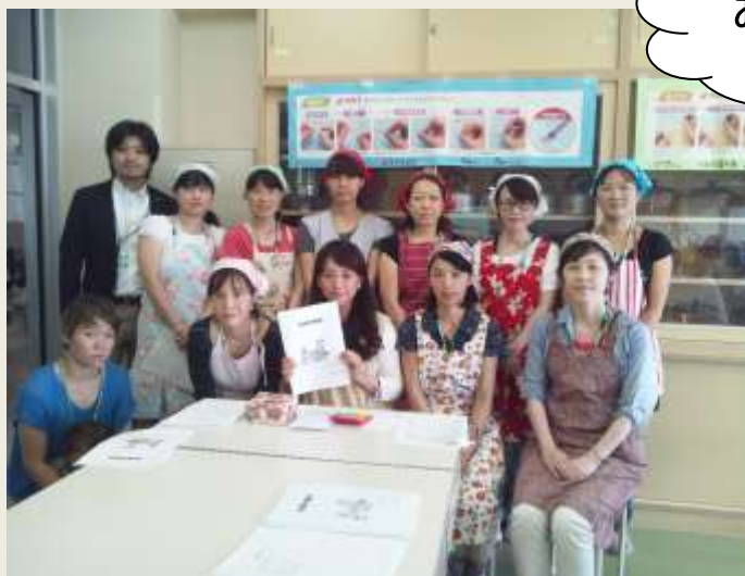
<1年 学年学級委員のみなさん>

1年学年学級委員のみなさんのご尽力により無事に給食試食会を終了することが出来ました。